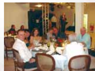
DRT 8 realiza jantar em comemoração aos 20 anos do Sinafresp .