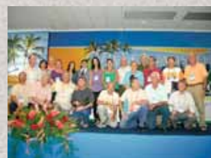
IV Plenafisco e IV Conafisco Extraordinário estão com inscrições abertas.