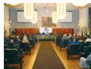
Sinafresp recebe Salva de Prata da Câmara Municipal de São Paulo.